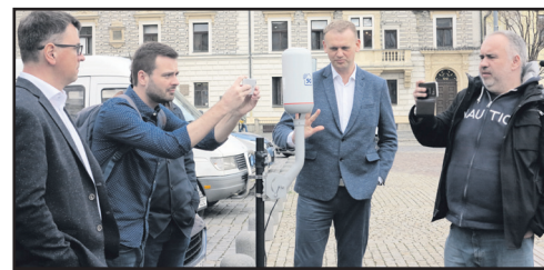
Centrum Kolína má nejrychlejší internet. Více na str. 4.

VÁŠ TRADIČNÍ REGIONÁLNÍ TÝDENÍK OD ROKU 1996